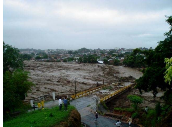
Figura 3. Ejemplo de fotografía a color