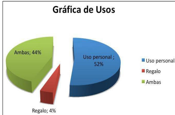
Figura 2. Ejemplo de Fotografía (en escala de grises).